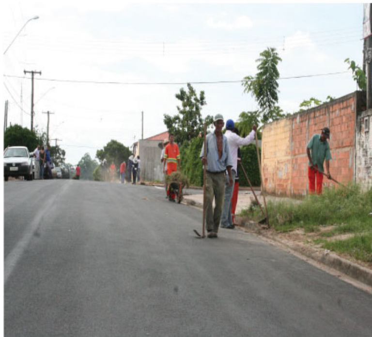
Servidores municipais realizam limpeza nas ruas do bairro; Paulistano com 100% de pavimentação

A Manhã de Lazer será realizada na rua Geraldo Preto Rodrigues, próxima a Escola Municipal do Jardim Paulistano. Até o meio dia, haverá shows musicais e recreação para as crianças e adolescentes.