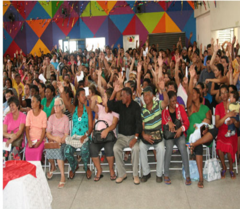
Assinatura do termo foi realizada no Centro do Idoso e contou com grande participação dos cadastrados

Na última segunda-feira, dia 21, no Centro de Convivência da Terceira Idade, as famílias assinaram o termo de adesão aos programas. As famílias receberão, nesse primeiro momento, R$ 1,3 mil, sendo R$ 1 mil pelo Novo Começo e R$ 300 referentes à primeira parcela do AME. A continuidade no auxílio moradia dependerá da necessidade da família permanecer no programa de acordo com avaliação da Secretaria de Habitação.