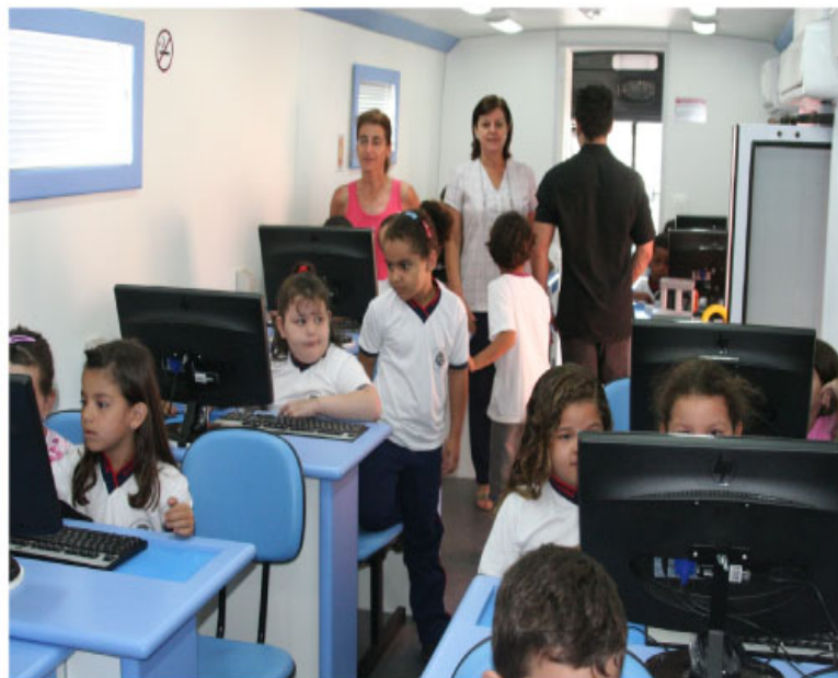
Construção das novas escolas atenderá alunos de ensino infantil e aumentará número de vaga na rede

No Jardim dos Ipês, a Prefeitura iniciou as obras de construção da primeira escola/creche para atender crianças de zero aos cinco anos da região do Maria Antonia/Dall'Orto. O prédio terá oito salas de aulas e atenderá cerca de 230 crianças, em dois períodos. Para construção da escola do Jardim dos Ipês, serão investidos R$ 1.316.432,50, obra da Prefeitura em parceria com o Governo Federal.