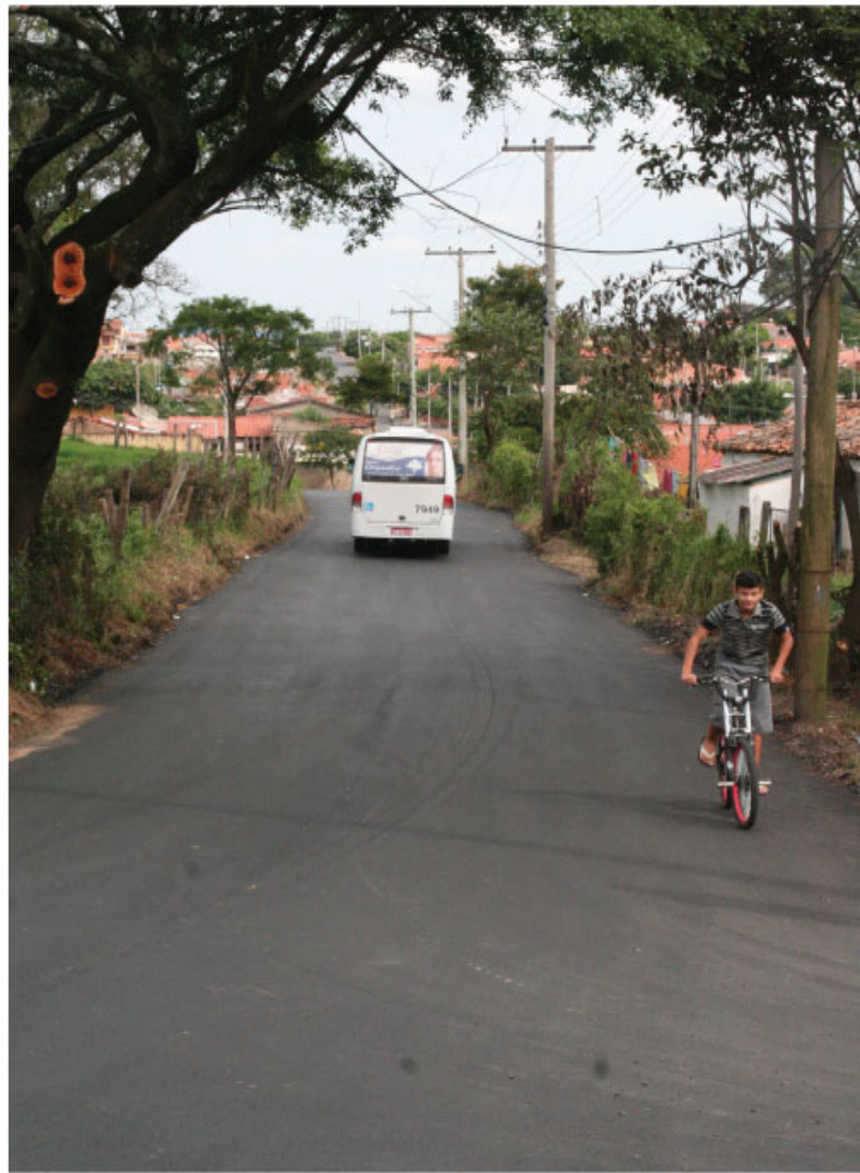
Entrada do Jardim Paulistano também recebeu melhorias, com a realização de recapeamento em toda a sua extensão

A Prefeitura ratificou ontem, dia 24, a assinatura do termo de compromisso para a construção de mais duas escolas de ensino infantil, a do Portal Bordon, região do Picerno, e a do Recanto dos Sonhos, região do Maria Antonia/Dall'Orto. Pág. 19