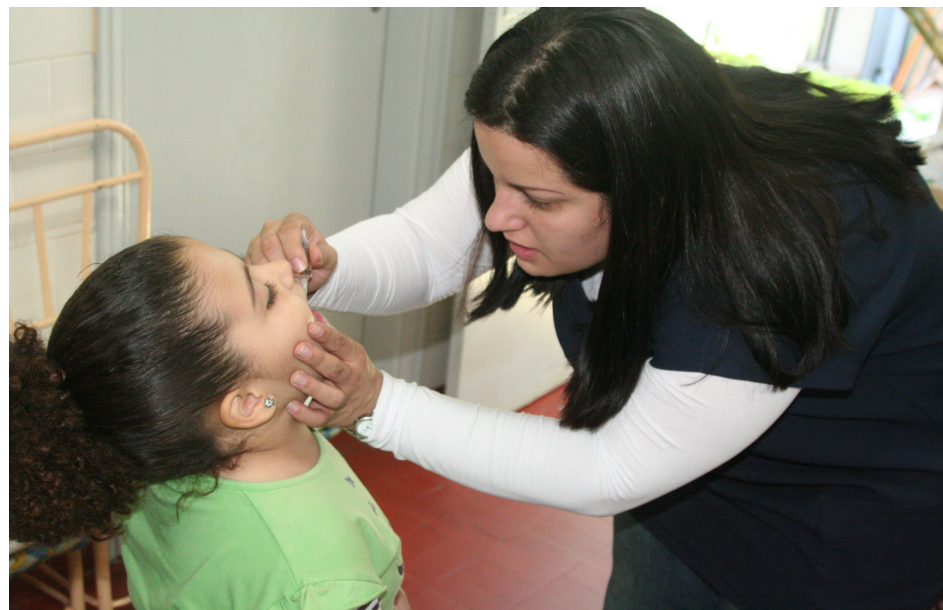
A vacina está disponível nas Unidades de Saúde até 6 de julho

De acordo com a Vigilância Epidemiológica de Sumaré, a vacinação, até amanhã (6), pode e deve ser feita nas unidades de saúde, com objetivo de vacinar pelo menos 16.998 crianças menores de cinco anos, já que a meta estipulada pelo Ministério da Saúde (MS) é de vacinar 95% das crianças. A Vigilância ressalta que é importante que todas as crianças menores de cinco anos sejam levadas ao posto de saúde mais pró-