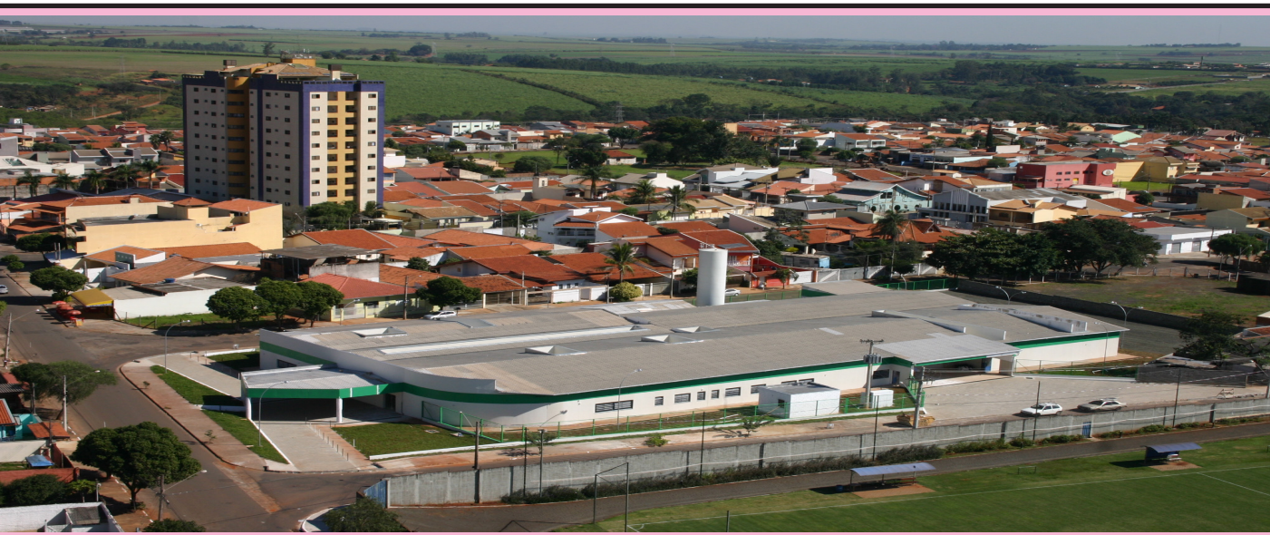
Construção da Unidade de Pronto Atendimento no Jardim Macarenko, que funcionará 24 horas, teve investimentos de R$ 964 mil