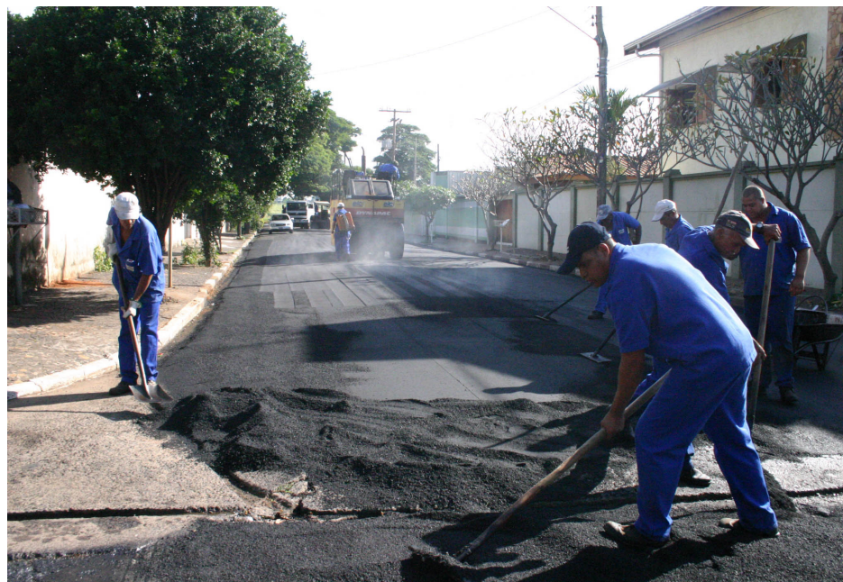
Convênio com Governo Federal garante intervenção em 26 vias da cidade

Em razão da legislação eleitoral, a primeira medição deverá ser apresentada até 30 de junho, por isso, as empresas Simoso e EIC estão abrindo frentes de trabalho em vários pontos da cidade, no total são 10 contratos.