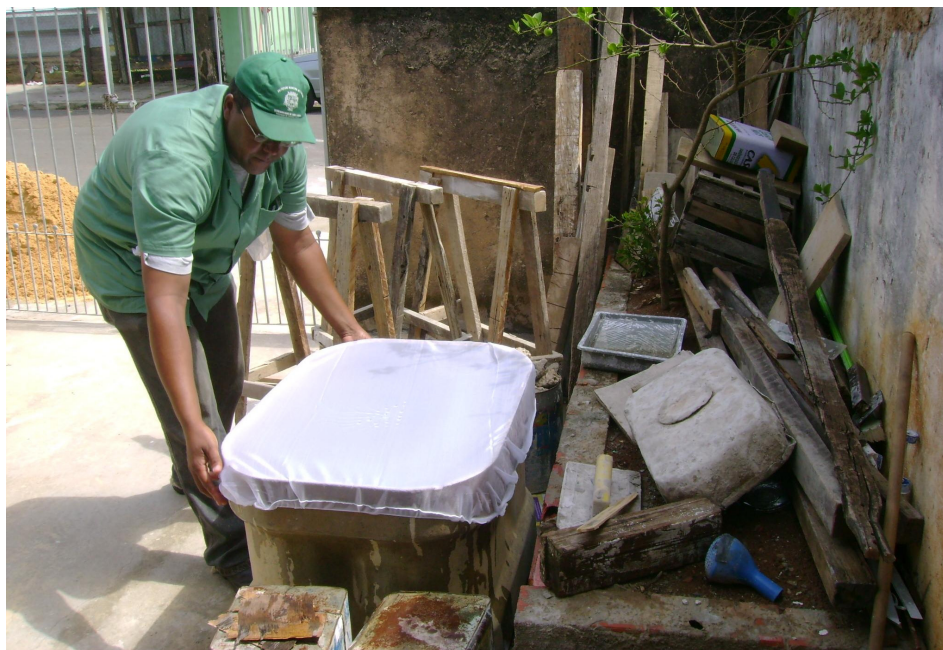
Agentes farão distribuição e colocação de telas para tampar caixas d'água

De acordo com a coordenação do Programa Combate à Dengue, a ação contará com o apoio de mais de 200 trabalhadores, entre agentes de Combate de Endemias e agentes Comunitários de Saúde, que farão visitas casa a casa, buscando suspeitos, realizando bloqueio e controle de criadouros (recipientes com água limpa e parada) dentro de casa, nos quintais, e orientando os moradores. É importante a colaboração dos moradores, permitindo a entrada dos agentes nas residências para realizar os trabalhos. Os agentes e voluntários estarão identificados por coletes da Prefeitura em Ação Contra a Dengue. A Secretaria de Saúde de Sumaré destaca que o objetivo dessa