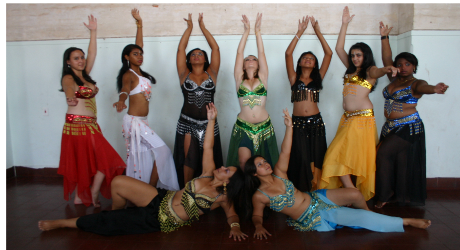
Equipe de dança do ventre foi um dos destaques no Festival de Outono 2012