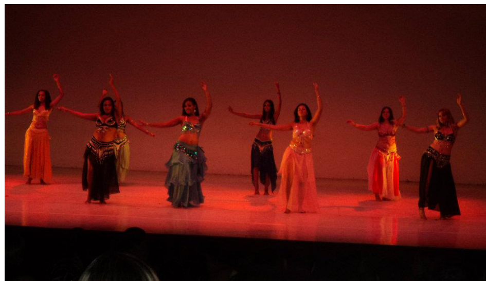
Sumareenses conquistaram três títulos e um segundo e terceiro lugares

Em relação as aulas, continuam abertas as vagas para a dança do ventre, aulas ministradas pelo projeto Cidadania Esportiva no prédio da Subestação - avenida José Mancine, s/nº. As aulas acontecem todos os sábados. Mais informações pelo telefone (19) 3828-8338.