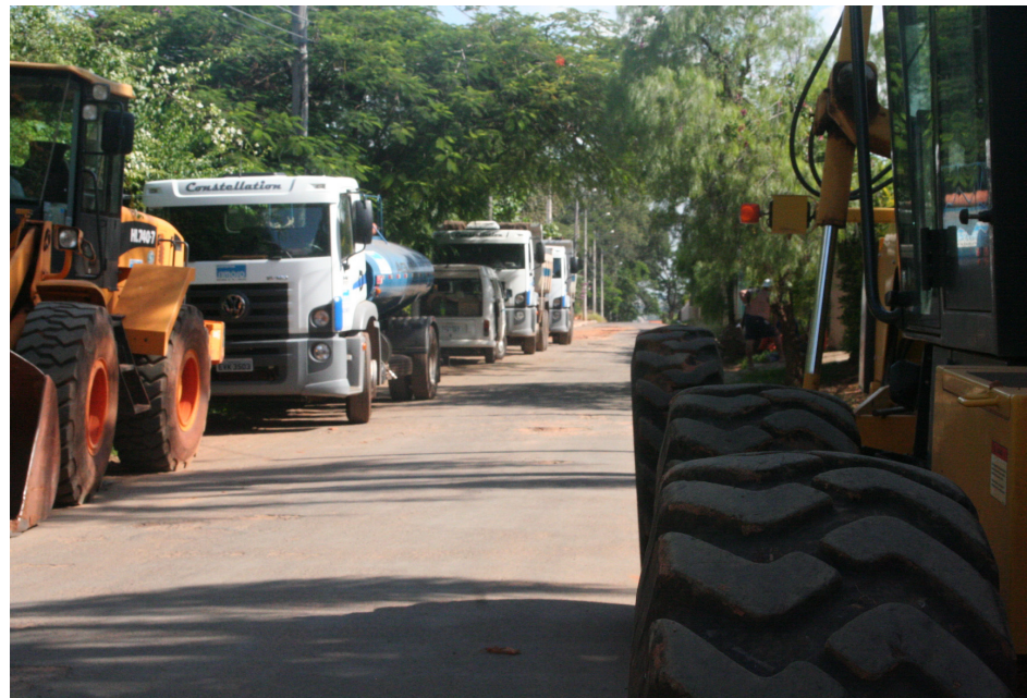
Empresa responsável pela obra já começou a trabalhar nas Chácaras Bela Vista

Com a realização da pavimentação, representantes do Hospital Madre Teodora informaram que as obras da futura unidade sumareense estão em fase de acabamento e a inauguração deve ocorrer no segundo semestre deste ano.