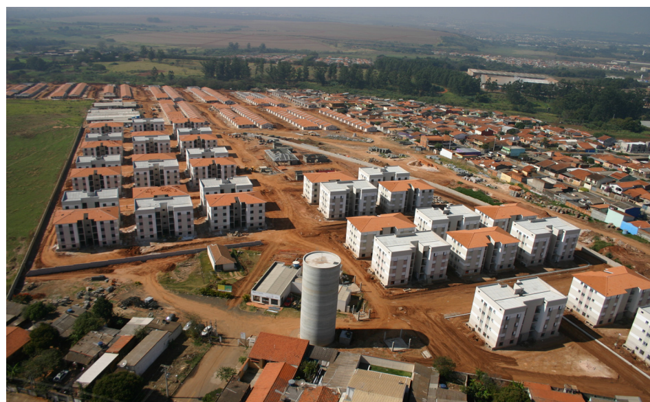
Região do Matão contará com mais um empreendimento do Minha Casa, Minha Vida

De acordo com informações da Secretaria Municipal de Habitação, os novos apartamentos serão destinados às famílias que vivem, preferencialmente, em áreas de risco do município e cuja renda mensal total não ultrapasse três salários mínimos. A demanda deve obedecer, obrigatoriamente, a portaria 610, do Ministério das Cidades, que disciplina a indicação de beneficiários do programa "Minha Casa, Minha Vida". Todas as unidades são compostas por dois dormitórios, cozinha, banheiro, área de serviço, além de um espaço de lazer para os moradores dentro do condomínio. O evento que vai selar o convênio está marcado para o dia 11 de abril, às 10h, no Centro de Convivência do Idoso, que fica localizado na avenida Brasil, 1.111, em Nova Veneza.