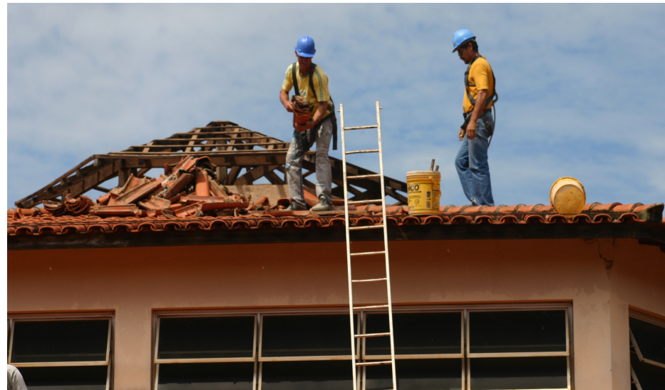
Reforma do velório municipal contou também com a troca do telhado

reformas dos banheiros, o local está recebendo desde o início da semana serviços de capinação e limpeza em todas as imediações, nas quadras e entre os túmulos. Recentemente também foi feita a reforma do telhado do Velório, instalação de iluminação de emergência e reformas de salas, como a da Administração. Também houve uma campanha de conscientização para que proprietários de jazigos perpétuos zelem pela conservação dos mesmos. Também ocorrem com frequência no Cemitério as ações preventivas contra a dengue, com eliminação de objetos que possam acumular água da chuva e tornarem-se criadouros do mosquito transmissor da doença.