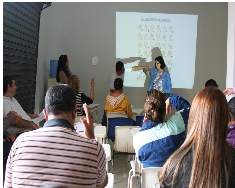
Inscrições para o curso de LIBRAS podem ser feitas até o dia 10 de abril

5.626/2005. O objetivo do curso é capacitar interessados, do município de Sumaré, em LIBRAS, oferecendo o preparo técnico para a melhoria no atendimento da demanda e cumprimento das exigências legais, em benefício às pessoas surdas e com deficiência auditiva. Serão formadas até duas turmas com datas diferenciadas, conforme a disponibilidade de vagas. O Curso terá a carga horária e certificação de 36 horas presenciais e será no prédio da Faculdade Anhanguera, com duas horas semanais. O que diferencia a Língua de Sinais das demais línguas orais é a sua modalidade visual-espacial. Assim, a pessoa que aprende a Libras vivencia e sente como é a maneira de se comunicar sem som, acompanhado de expressão facial, corporal, gestuais visuais baseados no uso das mãos, olhos, boca. O contato com uma língua de sinais amplia a rede de comunicação, favorece a inclusão do surdo na sociedade, além de valorizar a atividade profissional de quem aprende.