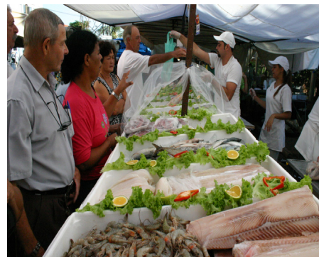
Feira do Peixe: tradição na Semana Santa

PICERNO - Rua Pajé (antigo local da feira) 05/04 - 07h às 17h 06/04 - Feira até às 12h