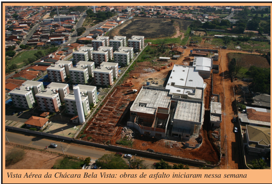
Vista Aérea da Chácara Bela Vista: obras de asfalto iniciaram nessa semana

A Prefeitura Municipal de Sumaré, por meio da Secretaria de Habitação, realiza na próxima quarta-feira (dia 11) assinatura do contrato entre a Caixa Econômica Federal e a Construtora Cury, para a construção de 2.396 unidades habitacionais dentro do programa do Governo Federal "Minha Casa, Minha Vida". O valor total do projeto, que deverá ser exe-