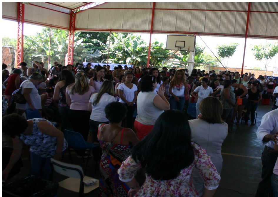
Atividade reuniu mais de 400 mulheres no Centro Regional de Assistência Social

O Centro de Referência em Assistência Social (CRAS) da Área Cura realizou ontem (dia 8) homenagem especial em comemoração ao Dia Internacional da Mulher. O núcleo recebeu as mulheres inscritas nos projetos sociais do município, da comunidade local e da cooperativa de catadores da região. Cerca de 400 mulheres participaram do café da manhã, que foi preparado em parceria com a empresa Sotreq. A homenagem contou com apresentações musicais e de poesias e também houve a entrega de presentes confeccionados pelas crianças e adolescentes integrantes dos serviços de convivência e fortalecimento de vínculos desenvolvidos pela Secretaria Municipal de Inclusão, Assistência e Desenvolvimento Social. O CRAS da Área Cura atende aproximadamente 196 crianças por meio do PETI (Pro-