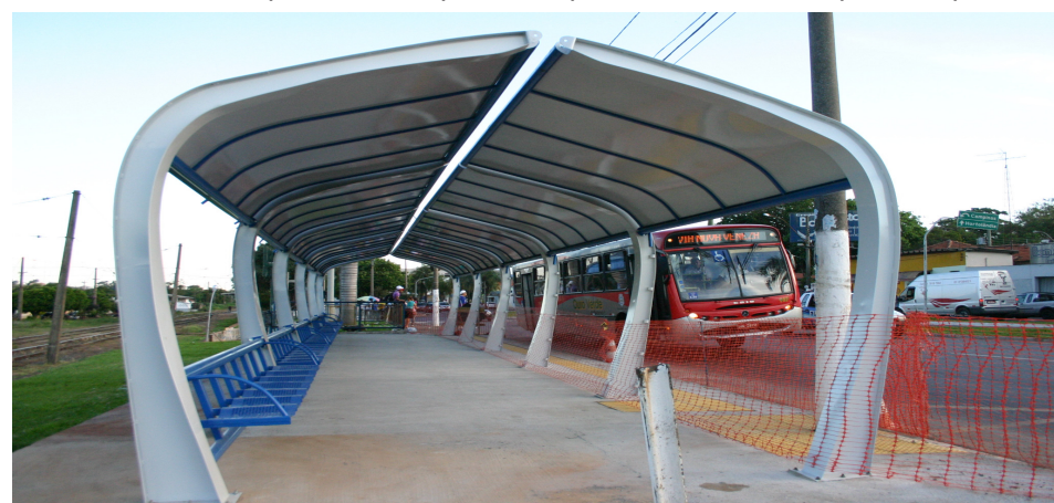
Novos pontos de parada começam a ser construídos hoje na região central