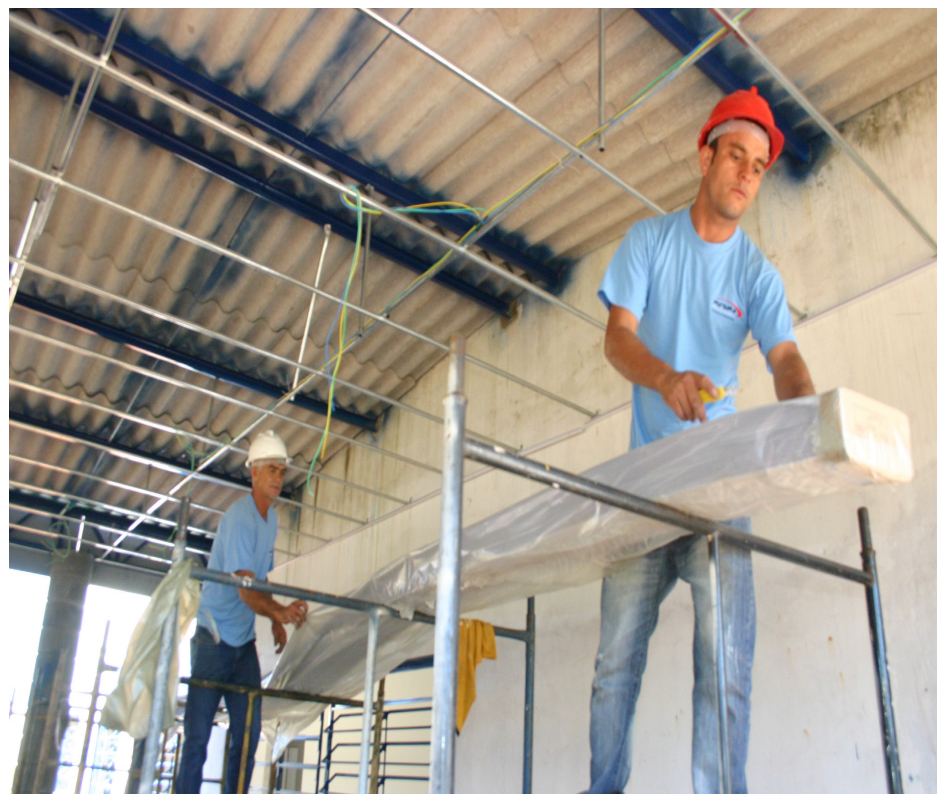
Pronto Socorro Municipal será entregue ainda neste semestre de 2011

As duas empresas foram definidas em regime de urgência, conforme prevê a Lei Nacional de Licitações nº 8.666/93, com base no reconhecimento pelo Governo do Estado de São Paulo do Decreto de Estado de Emergência de Sumaré, depois do vendaval que atingiu a cidade no início de novembro.