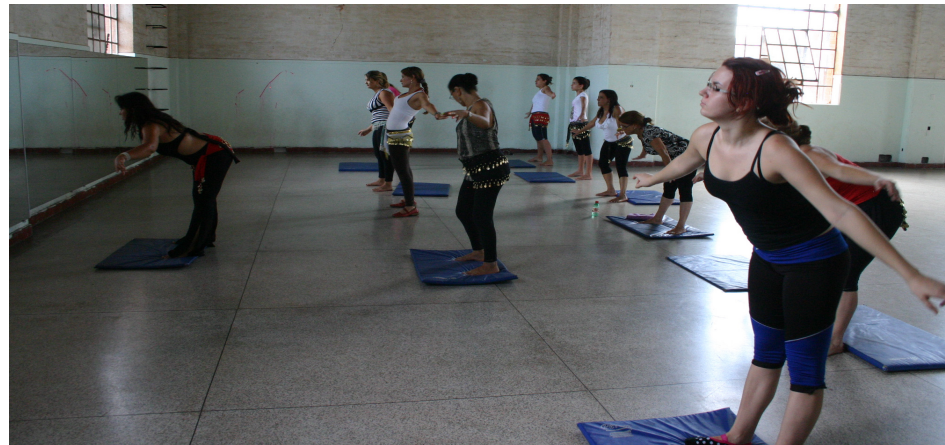
Inscrições visam formação de turma iniciante de dança do ventre