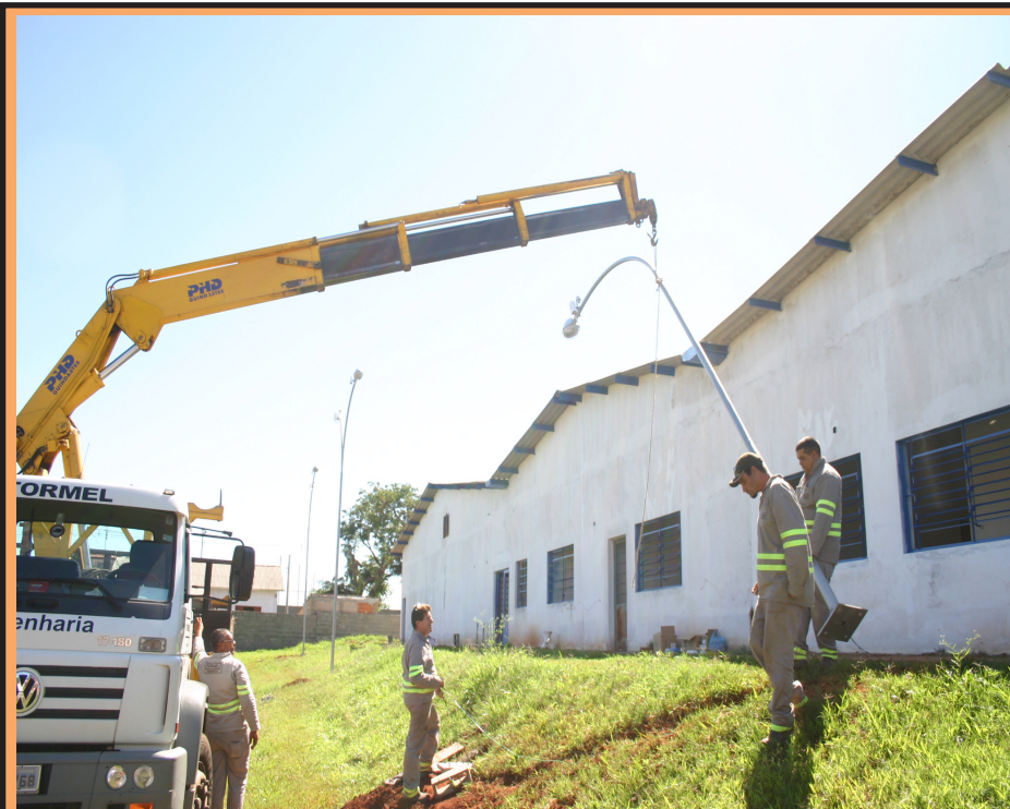
Obras continuam em ritmo acelerado para conclusão do Pronto Socorro do Jardim Macarenko

Sexta-feira, 09 de março de 2012 - Ano 02- Nº 57