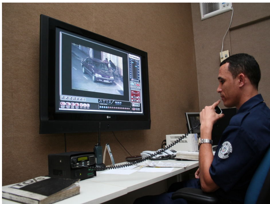
Além das câmeras será implantado o Gabinete de Gestão Integrada Municipal

A Prefeitura de Sumaré, por meio da Secretaria Municipal de Segurança e Defesa Civil, informou que o sistema de monitoramento com câmeras de segurança entrará em operação dentro de 40 dias. No total, serão 23 câmeras que serão instaladas em pontos estratégicos nas seis regiões da cidade. O projeto de implantação do sistema de monitoramento, com a implantação de Gabinete de Gestão Integrada Municipal, foi conquistado por meio do Programa Nacional de Segurança Pública com Cidadania (Pronasci). O programa prevê a instalação de câmeras de monitoramento, sala de trabalho e gabinete de gestão integrada. Essas salas serão criadas no prédio da Guarda Municipal. De acordo com o comando da Guarda Municipal, as câmeras serão instaladas em diversos pontos da