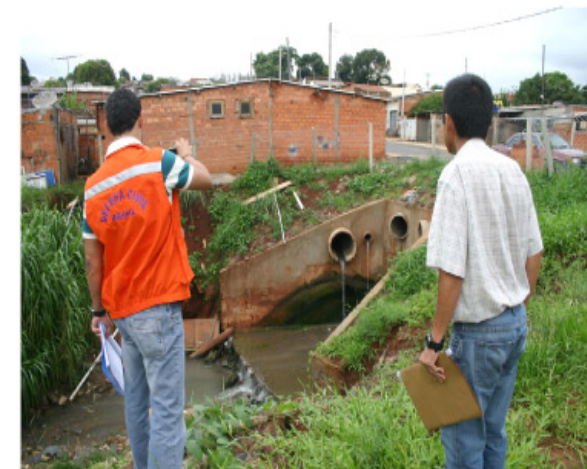
Engenheiro do Ministério da Integração Nacional visitou in loco as nove obras emergenciais executadas pela Prefeitura

contenção de erosão do Jardim Novo Paraná e Antonio Pereira de Camargo e a recuperação de pavimento das ruas Manuel Antonio de Almeida (Casarão), Vítório Zagui, Ednei Aparecido Sgobin e Marco Liash (Vila Menuzzo) e da rua Rodrigo Gui-