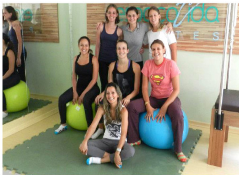
Aulas de Pilates serão realizadas no prédio da Subestação da Fepasa