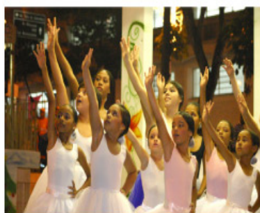
Aulas de balé são gratuitas

Segundo informações da coordenação do Ponto de Cultura do Matão, a grande novidade é a introdução do conceito capoeira na área de dança. Em