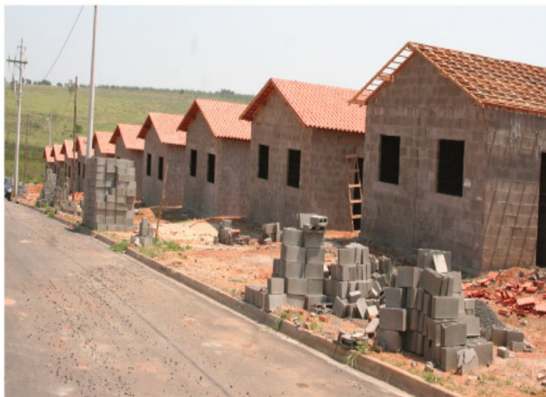
Construção de 135 moradias estão dentro do cronograma da Secretaria de Habitação

O investimento para a construção das unidades habitacionais será na ordem de R$ 3.922.386,90, com recursos oriundos do Fundo Nacional de Habitação de Interesse Social (FNHIS), sendo cerca de R$ 470 mil de contrapartida do município. A Prefeitura realizou ainda a desapropriação dos lotes no Parque Residencial Portal Bordon II, um investimento superior a R$ 2 milhões. As casas terão 33 m 2 , com possibilidade de ampliação.