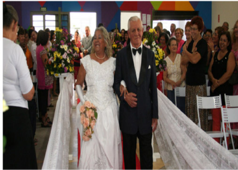
Faculdade Anhanguera recebe mais uma edição do casamento comunitário de Sumaré

A Prefeitura de Sumaré realiza Casamentos Comunitários desde 2006, tanto na região de Nova Veneza como na área central e, até o momento, foram oficializadas mais de 700 uniões.