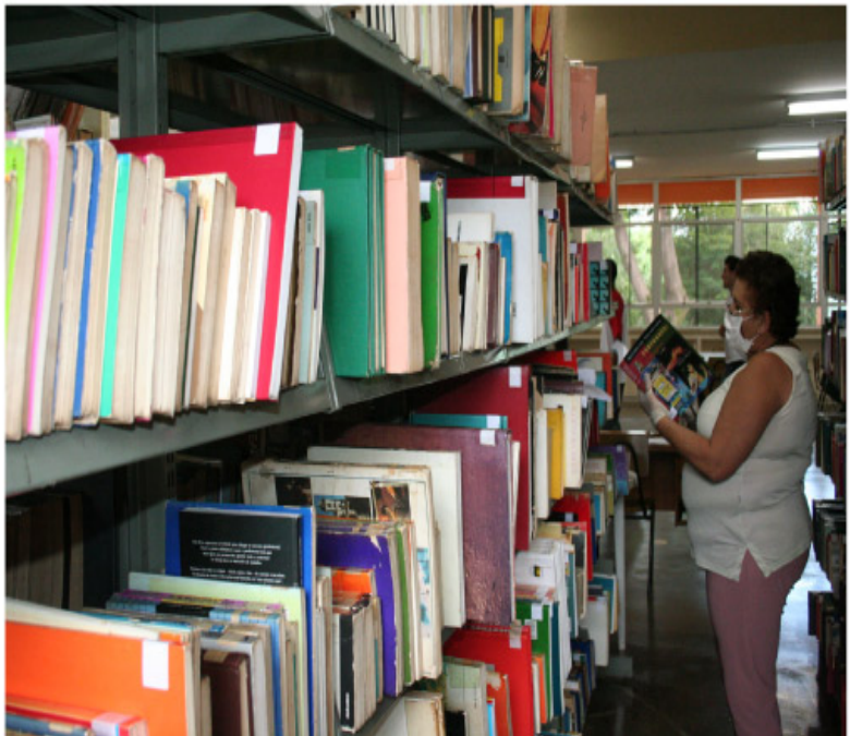
Bibliotecas Municipais de Sumaré integram novo sistema de informatização

Já pensou ter acesso a mais de 50 mil títulos de livros e de autores com um único cadastro? Poder consultar este catálogo com toda comodidade, sem sair de casa? Ter acesso livre a quatro bibliotecas e receber as novidades por email? Isso e muito mais será possível, em Sumaré, a partir de dezembro, mais especificamente na Rede de Bibliotecas Públicas. Nos dias 17 e 18 de novembro, das 8h30 às 17 horas, os funcionários das Bibliotecas farão treinamento para o novo sistema de automação de Bibliotecas (BNWEB-Sysbibli). No treinamento, em parceria com a Faculdade Anhanguera - Unidade Sumaré - que disponibilizará o laboratório de informática, os funcionários aprenderão os processos de atendimento e processamento técnico do Sistema Sysbibli. O Sysbibli- BnWeb permite o gerenciamento de uma instituição, seja ela uma biblioteca, um arquivo ou centro de documentação. Além dos serviços tradicionais como: Aquisição, Processamento Técnico, Empréstimo, Controle de Periódicos, Vocabulário, Padrão MEC e outros, o Sysbibli emite diferentes tipos de relatórios e estatísticas. Os mecanismos gerenciais do Sysbibli incluem a emissão