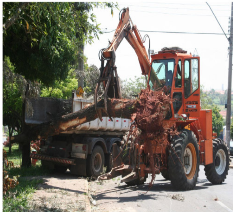
Secretaria de Serviços Públicos vem intensificando o trabalho de limpeza e remoção de árvores

A Prefeitura aguarda o envio de verbas pelo Governo do Estado, após o decreto do Estado de Emergência, para a reparação dos danos causados ao município, inclusive o plantio de novos exemplares arbóreos. Antes mesmo do vendaval, a Secretaria de