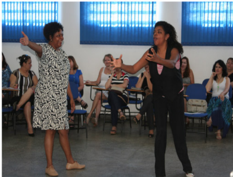
Atividade de formação e capacitação de professores termina hoje no Cefems

Dia 11 - A proposta de trabalho (pela manhã) é capacitar integrantes as sete coordenadorias ligadas a Secretaria de Governo e Participação Cidadã e servidores da própria secretaria. O período da tarde será dedicado a formação de integrantes do Conselho Municipal de Igualdade Racial.