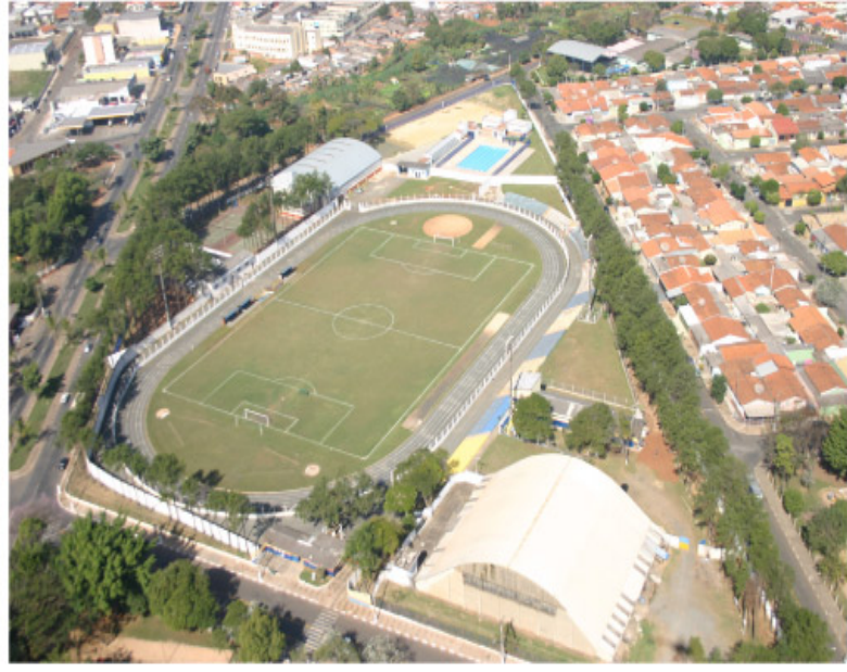
Ginásio do Centro Esportivo será palco da Virada Inclusiva de Sumaré

A Virada Inclusiva foi a forma de o Governo do Estado de São Paulo, por intermédio da Secretaria de Estado dos Direitos da Pessoa com Deficiência, celebrar o "Dia Internacional da Pessoa com Deficiência" (3 de dezembro), tendo por finalidade difundir políticas públicas voltadas à população com deficiência e suas famílias.