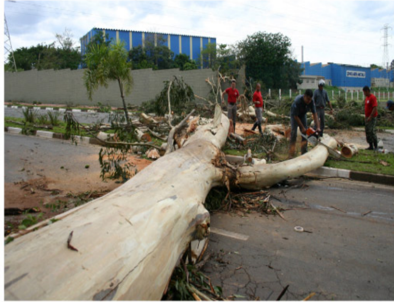
Em toda a cidade, mais de 800 árvores foram arrancadas com a força dos ventos

de 800 árvores, estragos em 300 residências, comércios e prédios públicos. Anteontem, dia 9, o Governo do Estado de São Paulo publicou no Diário Oficial a homologação do Estado de Emergência de Sumaré. Com os reconhecimentos por parte do Estado e do Governo Federal a Prefeitura estará habilitada a receber possíveis verbas e fazer frente aos prejuízos causados pelos fortes ventos que atingiram a cidade. O Estado de Emergência também autoriza a Prefeitura a contratar serviços emergenciais, independentemente de licitação em seus moldes convencionais.