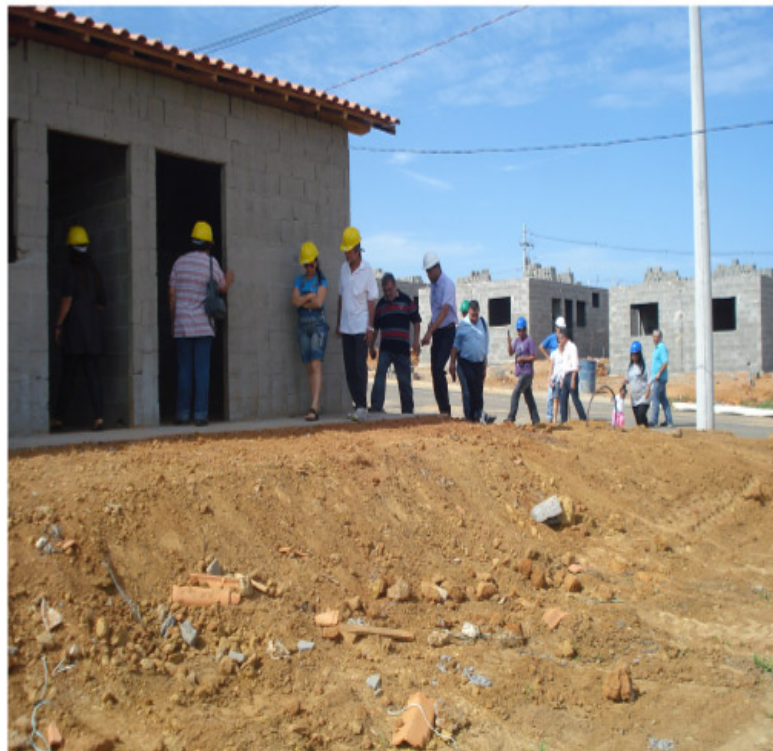
Futuros moradores realizaram vistoria junto com técnicos da Secretaria de Habitação

O investimento para a construção das unidades habitacionais será na ordem de R$ 3.922.386,90, com recursos oriundos do Fundo Nacional de Habitação de Interesse Social (FNHIS), sendo cerca de R$ 470 mil de contrapartida do município. A Prefeitura realizou ainda a desapropria-