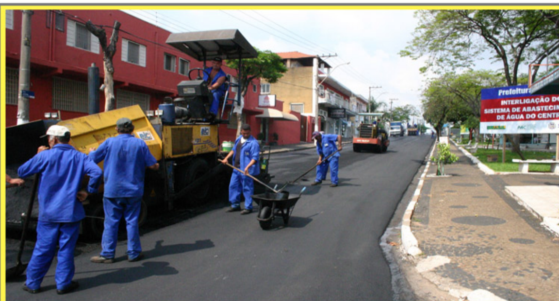
As obras de recapeamento asfáltico em 18 ruas e avenidas da região central sumareense foram retomadas ontem (dia 26) pela Secretaria Municipal de Obras. Motoristas devem redobrar a atenção e seguir as orientações de trânsito.

As inscrições podem ser feitas Secretaria Municipal de Cultura, Esportes e Lazer - rua Antonio do Vale Mello, 1.129. Para ser aceita a inscrição, o músico deve enviar gravação da música em CD ou DVD, com a respectiva letra e interpretação musical que será apresentada. Pág.23