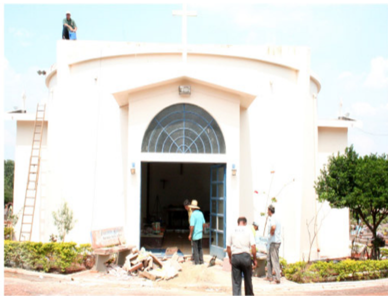
Capela do Cemitério da Saudade foi um dos espaços que passou por reforma

nida da Saudade, 981, Jardim Planalto do Sol. Informações sobre número de quadras e local de sepultamentos podem ser obtidas pelo telefone: (19)3873-9887. Nos últimos dias, o Cemitério Municipal recebeu diversas melhorias, como a reforma da capela, sala da Administração e banheiros públicos, sinalizações de quadras e pinturas de guias e dos muros. Houve ainda limpezas e reformas, providenciadas por familiares, de vários jazigos perpétuos, isso após a Administração fazer notificações por telefone e pela imprensa para que responsáveis pelos túmulos particulares tomassem providências quanto a manutenção dos túmulos.