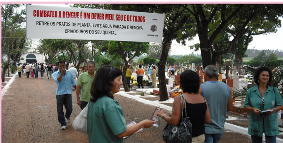
Os agentes de controle de endemias, do Programa de Combate à Dengue de Sumaré, participarão de operações especiais, dias 1º e 2 de novembro, das 8 às 16 horas, no Cemitério da Saudade, na região central, com objetivo de diminuir riscos de proliferação do mosquito Aedes aegypti , transmissor da dengue. A ação ocorre no Feriado prolongado pelo Dia de Finados, justamente porque aumenta o movimento nos cemitérios e as pessoas serão orientadas para que não depositem objetos que possam acumular água da chuva e formarem criadouros de mosquitos. No Cemitério da Saudade são esperadas mais de 25 mil visitantes durante os feriados.