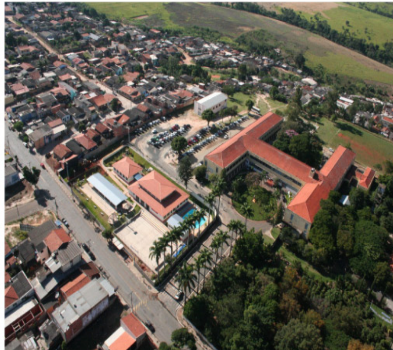
Atendimento acontece as segundas, quartas e sextas no Centro Administrativo

No mês de outubro, 8.568 famílias receberam regularmente o benefício. Em Sumaré, a meta do Ministério do Desenvolvimento Social é de 8.994 beneficiários. Além da busca ativa, a Central Única realiza, permanentemente, o cadastro das famílias. O atendimento acontece às segundas, quartas e sextas-feiras, das 8h às 16h, na sala 16, do Centro Administrativo, localizado à avenida Brasil, 1.111, Jardim Nova Veneza. Para continuar recebendo o benefício é importante que as famílias já inscritas atuali-