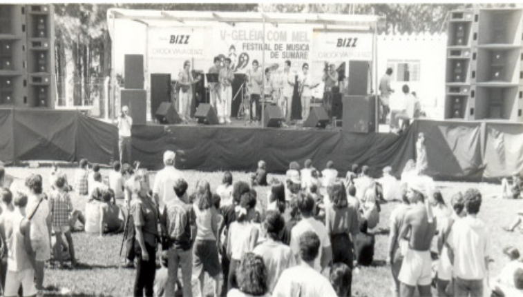
Foto da década de 1990 durante realização do quinto Festival Geleia com Mel

A Prefeitura de Sumaré, por meio da Secretaria Municipal de Cultura, Esportes e Lazer, está com inscrições abertas, até 11 de novembro, para a 13ª edição do Festival de Música Geleia com Mel, que será realizado em 4 de dezembro, das 9 às 21 horas, na Praça de Esportes do Parque Amizade, região de Nova Veneza. A entrada para o evento será um quilo de alimento não perecível. Podem se inscrever bandas de rock, vocalistas, guitarristas, bateristas, entre outros músicos que queiram expressar seu talento musical, interpretando músicas de rock ou apresentando músicas inéditas. As inscrições podem ser feitas Secretaria Municipal de Cultura, Esportes e Lazer - rua Antonio do Vale Mello, 1.129. Para ser aceita a inscrição, o músico deve enviar gravação da música em CD