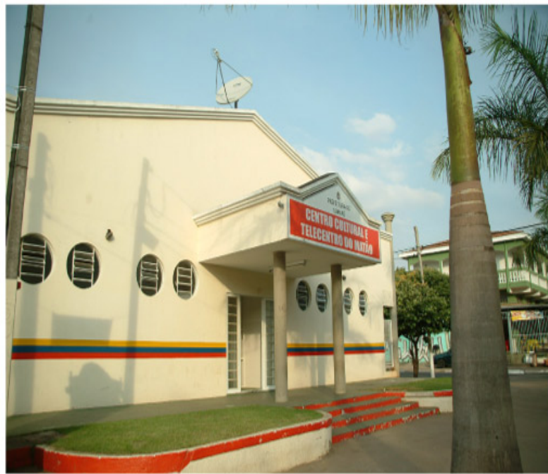
Centro Cultural do Matão fica localizado na Avenida Emilio Bosco

No domingo (dia 30), a partir das 9h tem a oficina de dança, terapia (Equilíbrio no Movimento) e no período da tarde, às 13h, tem o Dia de Arte Comunitária com galeria de arte e artesanato, mural de arte comunitária e diversas performances artísticas. Segundo a coordenação do Centro Cultural do Matão, o projeto é uma proposta cooperativa e comunitária de produzir e apresentar arte e cultura de forma participativa e sustentável. Todo o trabalho é desenvolvido por meio da ação voluntária de artistas, empresários, gestores públicos e estudantes de arte e as atividades são oferecidas gratuitamente a população. O projeto visa de criar uma rede de cooperativas entre artistas com a valorização da prática e da apreciação artística dentro da comunidade social.