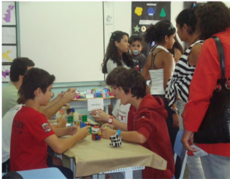
Escola José de Anchieta recebeu na semana passada mostra científica