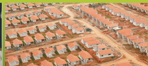
2820 NOVAS MORÁDIAS: 733 ENTREGUES E MAIS 2087 EM ANDAMENTO