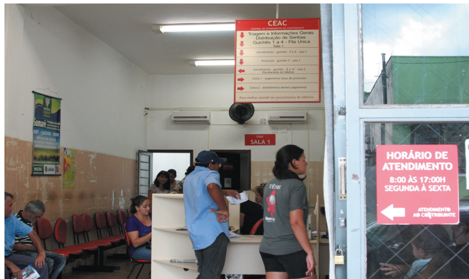
Dúvidas e informações na Central de Atendimento ao Contribuinte

Contribuintes de Sumaré tem até segunda-feira, dia 28 de fevereiro, para aproveitar o desconto de 10% da cota única do IPTU-2011. O desconto é um dos maiores da