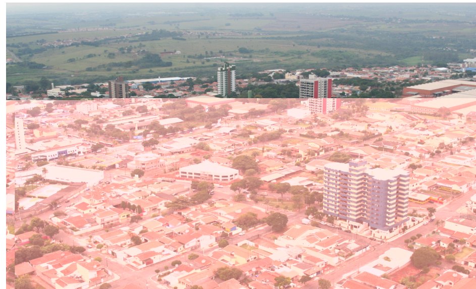
Grupo Enar terá sede no Pq. Emília, região central sumareense

Há dois anos a Prefeitura de Sumaré reduziu a alíquota do Imposto sobre Serviços, de 5% para 2%, para empresas do ramo de logística, deixando a cidade ainda mais atraente para novos investimentos. O município já conta com loca-