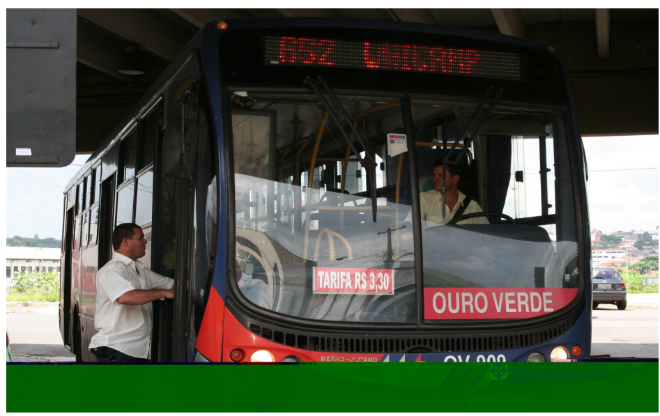
Nova linha beneficia Jd. São Francisco, Ipiranga, Nações e Maracanã

Atendendo proposta encaminhada pela Prefeitura de Sumaré em 2010, a Empresa Metropolitana de Transporte Urbano (EMTU) deu Ordem de Serviço à Auto Viação Ouro Verde para a implantação da linha 667, do Terminal Rodoviário de Sumaré, passando por Nova Veneza, seguindo para os Shoppings (Dom Pedro e Carrefour) e Unicamp. O novo itinerário beneficia diretamente os moradores dos jardins São Francisco, Maracanã, Ipiranga e Parque das Nações, bairros da Área Cura. A linha está em operação desde o dia 12 de fevereiro. De acordo com informações da EMTU, nos dias úteis, são 13 viagens, sendo sete delas saindo do Centro de Sumaré entre 5h50 e 21h20; e seis com saídas de Campinas entre 7h10 e 22h40. Será monitorada a frequência de passageiros na linha. A Secretaria Municipal de Mobilidade Urbana e Rural orienta aos usuários que ajudem a fiscalizar, principalmente quem mora nos referidos bairros da Área Cura. Aos sábados, domingos e feriados são previstas três viagens saindo de Sumaré e outras três com saídas de Campinas. É importante fiscalizar cumprimento de horário e número de viagem. As de-