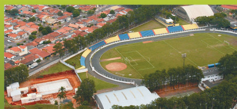
REFORMA DO CENTRO ESPORTIVO

Mais informações: 3873 8125 ou 3873 8123 | www.sumare.sp.gov.br