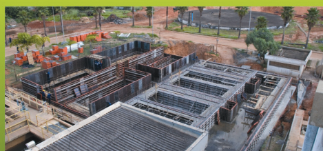
OBRAS DO PAC + ÁGUA PARA TODA A CIDADE