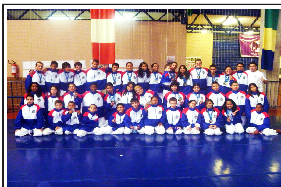
Equipe sumareense foi destaque na Copa Brasil de Karatê

De acordo com informações da secretaria, o objetivo do projeto foi de sensibilizar crianças e adolescentes sobre seu papel em relação a meio ambiente como agentes multiplicadores, que cuidam e preservam o meio onde vivem, promovendo redução da produção de lixo, reutilização de materiais, plantio de árvores e garantindo maior qualidade de vida.