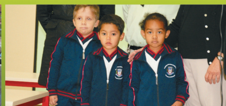
22 MIL ALUNOS BENEFICIADOS COM O KIT ESCOLAR