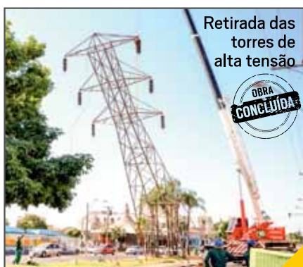
Retirada das torres de alta tensão