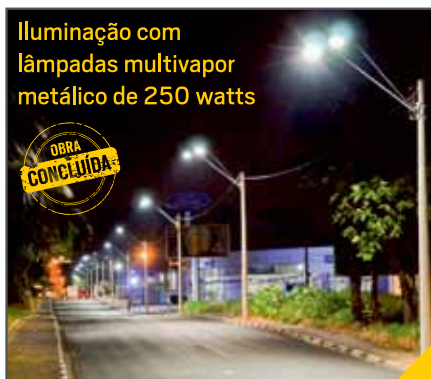
Iluminação com lâmpadas multivapor metálico de 250 watts