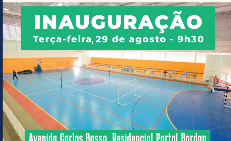
Avenida Carlos Basso, Residencial Portal Bordon

INAUGURAÇÃO Terça-feira, 29 de agosto - 9h30