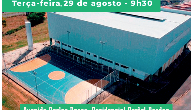
Avenida Carlos Basso, Residencial Portal Bordon

INAUGURAÇÃO Terça-feira, 29 de agosto - 9h30