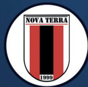
NOVA TERRA FC