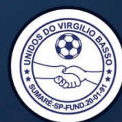
UNIDOS DO VIRGÍLIO BASSO